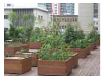
本社屋上庭園の菜園ボックス

2011年5月、クボタ本社に社員のコミュニケーションスペースの一部として屋上庭園を開設しました。多様な種類の樹木に加え、菜園や草花も設けることで、虫や鳥など生き物のすみ処や中継地になるよう、生物多様性の保全にも配慮しました。また、8月には近隣保育所の園児を招いて、野菜の収穫体験イベントを開催しました。