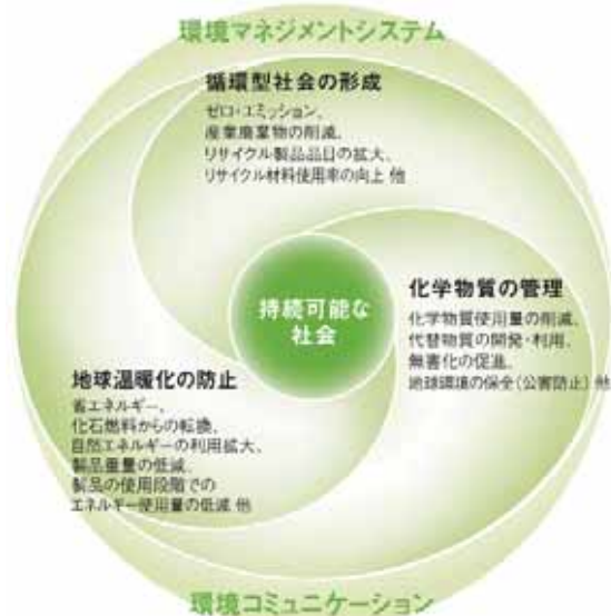
環境経営の基本方向 イメージ

クボタグループの環境経営の基本方向を実行するものとして、2009年度より環境保全中期計画を策定し、CO 2 排出削減を中心とした環境負荷削減活動を強化し、グローバルに展開しています。