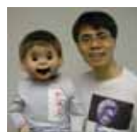
エコロジーロー氏