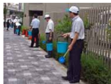
本所周辺での打ち水大作戦の様

クボタグループの社会貢献活動「クボタeプロジェクト」の一環として、夏の暑さを和らげるために、事業所周辺で「打ち水大作戦」を実施しました。クボタ本社では、食堂の厨房から出た排水を液中膜装置で処理した再生水を使用しました。