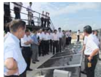
太陽光パネル説明